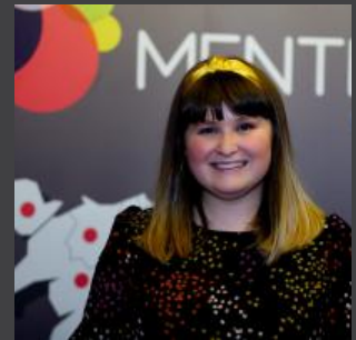
Marged Rhys Cydlynnydd Marchnata a Chyfathrebu