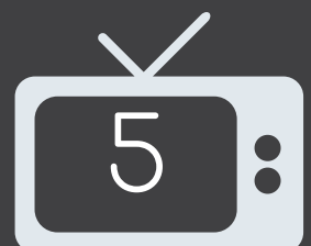
Cyfweiliad ar deledu cenedlaethol