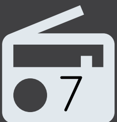
Cyfweiliad ar radio cenedlaethol