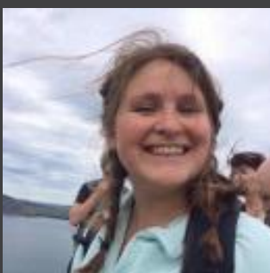
Marged Rhys Cydlynnydd Marchnata a Chyfathrebu